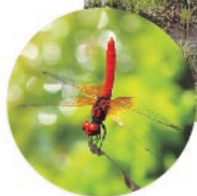
長ノ山湿原 / ハッチョウトンボ